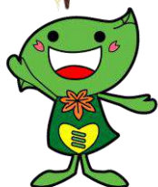
緑区のキャラクター ミドリリン