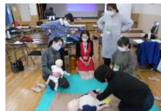
＜2日目の幼児安全法を研修中＞

緑区の子育て情報が満載☆ 見るだけでも楽しいサイト「みどりっこひろば」は、こちらからどうぞ！