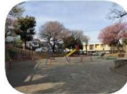
十日市場中里公園

原則現地集合・現地解散となります。いっぽからスタッフと一緒に行く方は10:15 出発です。