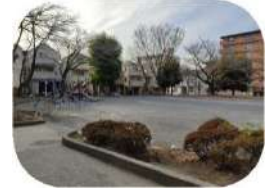
十日市場石田公園