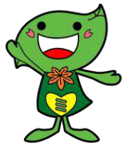
緑区のキャラクター ミドリン