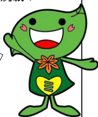
緑区のキャラクター ミドリン