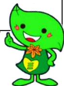
緑区のキャラクター ミドリ