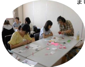
<名札つくりの様子>

6/21(金)に「名札作り」、7/10(水)に「ヨガ・ストレッチ」が行われママたちに楽しんでもらいました。「名札作り」からは「短時間で子供と離れて集中できて楽しかった」「お裁縫が滅法苦手な私でもとてもかわいい名札を作ることができました」「黙々と邪魔されずにできてストレス発散になりました」等、「ヨガ・ストレッチ」からは「初心者でも分かりやすくポーズができました」「普段体が硬くなっているのがよく分かりました。体が少し軽くなったような気がします」「体が硬いので私には不向きだと思いましたが無理なくストレッチできて気持ち良かったです」等の感想が寄せられました。ママたちの気分転換のためにやはりリフレッシュは必要ですね。次回のリフレッシュ講座をお楽しみに。