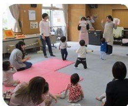
<おはなし会の様子>

5/8から始まった「みどりおはなしフェスタ」。緑区内で行われているお話し会を2か所・3回以上回ってスタンプを集めると、可愛いマスクットがもらえます。今回は、長津田地区で活動している【親子の居場所ふたば】のお話し会に行ってきました。【ふたば】は、長津田地区2か所のでママたちの気分転換・息抜きを提供している、親子の居場所です。この日の会場は長津田地域ケアプラザ。双子ちゃん1組を含めた8組の親子が、パラバルーンで遊んだり、パネルシアター“いぬのおまわりさん”等を楽しみました。【ふたば】にはランチタイムもあり、持ち込んだお弁当を食べながらスタッフが作った地元野菜たっぷりの汁物もいただけます。(参加費200円は汁物込み) 詳しい活動内容は左のQRコードから見る事が出来ます☆