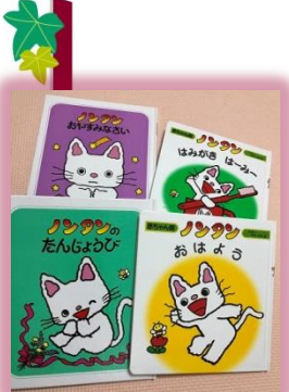
キヨノサチコさく・偕成社

私のお気に入りには絵本のノンタンシリーズです。自分が子どものときによく読んだのですが、息子が産まれて絵本を買うまですっかり忘れていました。かわいいキャラクターのイラスト、やさしいストーリー、感情豊かな台詞、読んでいて心があたたかくなる絵本です。赤ちゃん版もあるので子どもが小さいときからおすすめです。息子もノンタンの絵本が好きで、よく本を持ってきて読んでいます。自分が幼い頃に読んでいた絵本を自分の子どもが読んでいるのは不思議な感じがします。これから息子はいろいろな本に出会うと思います。お気に入りの一冊が見つかりますように。(ゆきママ)