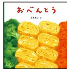
小西英子さく・福音館書店

この絵本を読むとお弁当作りがなんだか楽しみになります。流行のキャラ弁ではないのですが、絵本ではシンプルなお弁当のおかずが次々とやってきて、お弁当箱に詰まっていきます。最後の方の仕上げで白いご飯にごま塩をばらばらとかけるページでは、私もいっしょにごま塩をかけるマネはかかせません。寝る前の読み聞かせにもかかわらず、いつも「食べたいな～」と思いつつ読んでいます。(スタッフH)