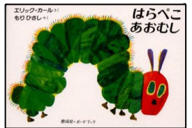
エリック・カール作 もりなさし翻訳 偕成社

真似をしていました。やがて青虫は大きくなって太っちょのさなぎになり ます。毎回この場面では親子でちょっとドキドキしてゆくりとペ ージを開き、色鮮やかな蝶々に出会い、ニコニコして眠りにつ きました。ちょうどその頃さなぎになり たての本物の青虫を庭で見つ けて蝶になる様子を親子で見守 ったことも良い思い出です。 (本当は虫が苦手なO)